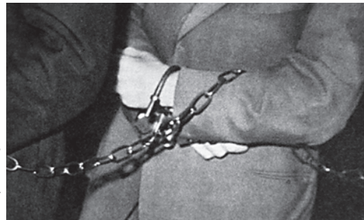
Ein Land und seine Freiheitskämpfer in Ketten

Dieses Verhalten ermöglichte in der Ära nach Außenminister Dr. Kreisky eine Eskalation der Folterungen von