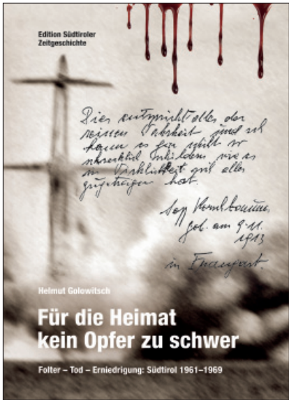
Für die Heimat kein Opfer zu schwer Folter-Tod-Erniedrigung: Südtirol 1961-1969 720 Seiten, 500 Abb., geb., 28,50 €