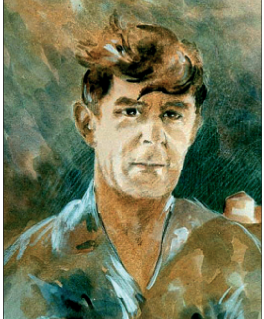
Sepp Kerschbaumer – der charismatische Anführer der Freiheitskämpfer

Als in den 1960er Jahren der „Befreiungsausschuß Südtirol“ (BAS) die faschistische Entnationalisierungspolitik auf die Müllhalde der Geschichte verwies, antwortete Rom mit Repression und Folter. Unter großen Opfern und Leiden, die erst später gewürdigt wurden, wurde die Autonomie errungen. Ein gefolterter politischer Häftling hat seine und die Haltung seiner Kameraden in einem Brief aus dem Gefängnis kund getan: „Die Opfer hier und die Opfer bei meiner Familie zuhause sind schwer, aber nicht zu schwer, wenn sie Früchte bringen.“ In Anlehnung an diese Worte trägt diese Dokumentation den Titel „Für die Heimat kein Opfer zu schwer“. Sie stellt die Folterungen und den Kampf der politischen Gefangenen für die Menschenrechte ihres Volkes bis hin vor die Schranken der Gerichte anhand teilweise erstmals veröffentlichter Briefe und Dokumente dar. Die Erinnerung an das damalige Geschehen soll keine Klüfte aufreißen. Sie soll aber mahnen und einen Beitrag zu einer grundlegenden Betrachtung der Menschenrechte einschließlich des immer wieder angefeindeten und bestrittenen Rechtes auf Selbstbestimmung leisten.